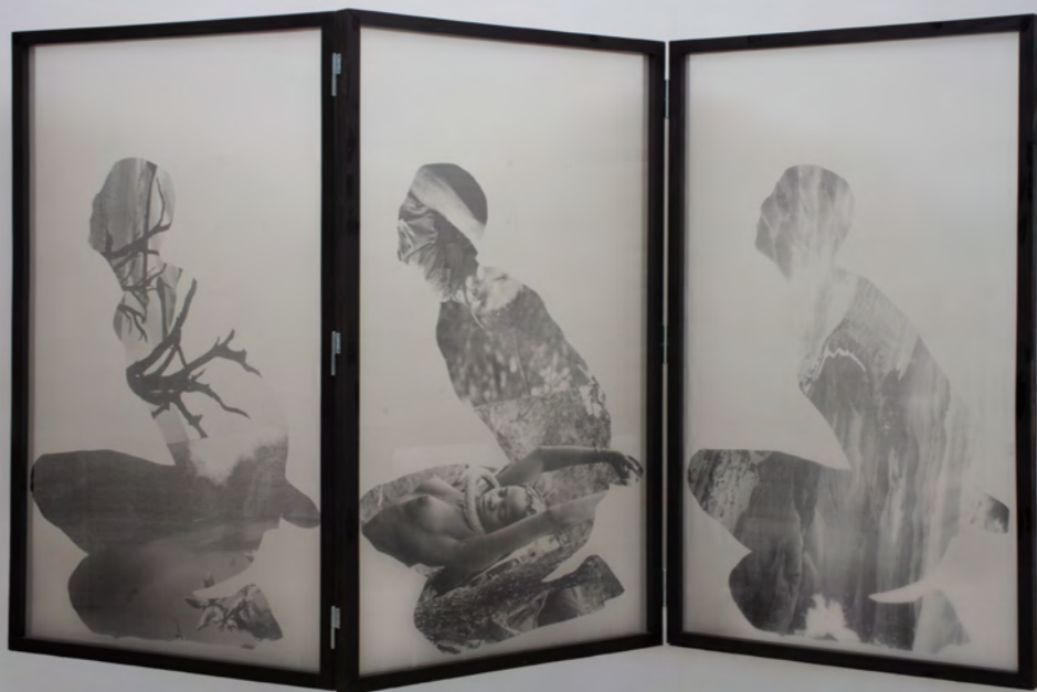
Reza Aramesh, Action 213, Un resabio de austera luminosidad , 2019