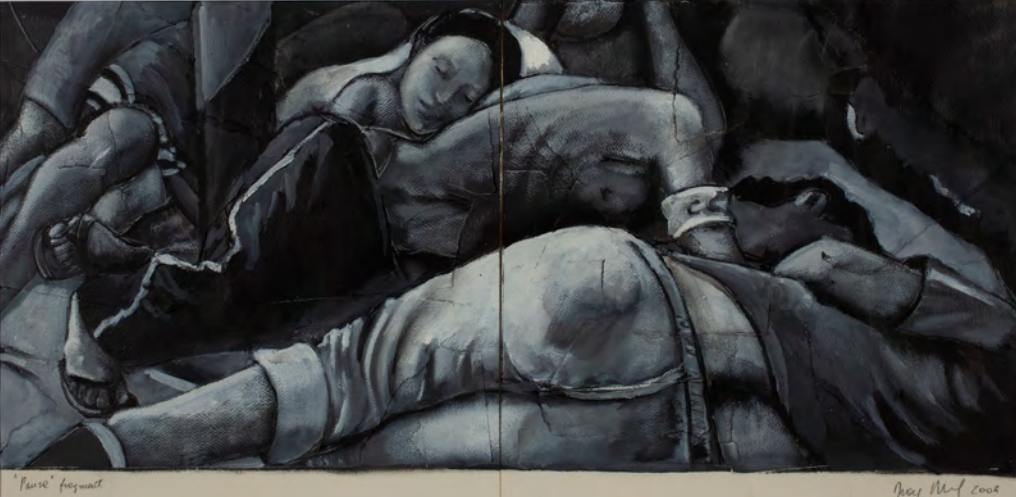
Diana Dowek, Pausa fragmento 1 , de la serie La larga marcha , 2002

Al poema le incumbe todo, aun la tierra más ingrata, la prueba más dura. De su confrontación consigo mismo no está ausente la guerra con lo ajeno. Todo y nada están ahí para ser dichos. El poema es el puente que une dos extremos ignorados. Pero es también esos extremos. El poema es una venturosa incursión por lo ignorado.