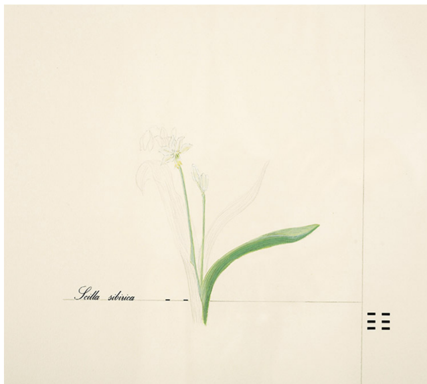
Sin título, de la serie Flores venenosas , 1977.