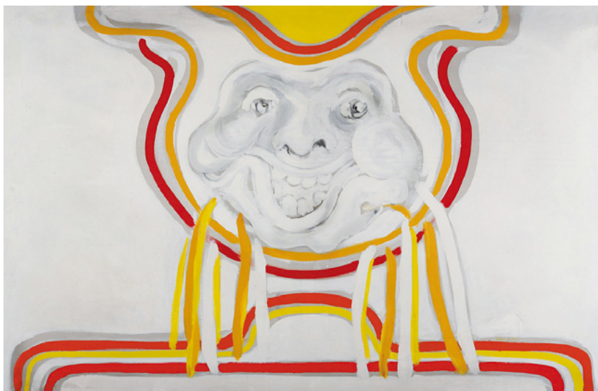
Sin título, de la serie La risa , 1965.