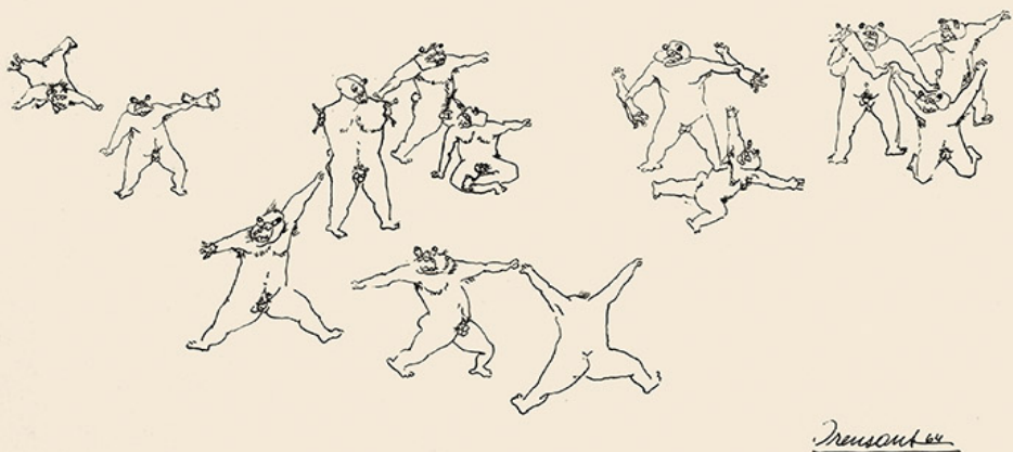
Sin título, de la serie Los dominantes , 1966.