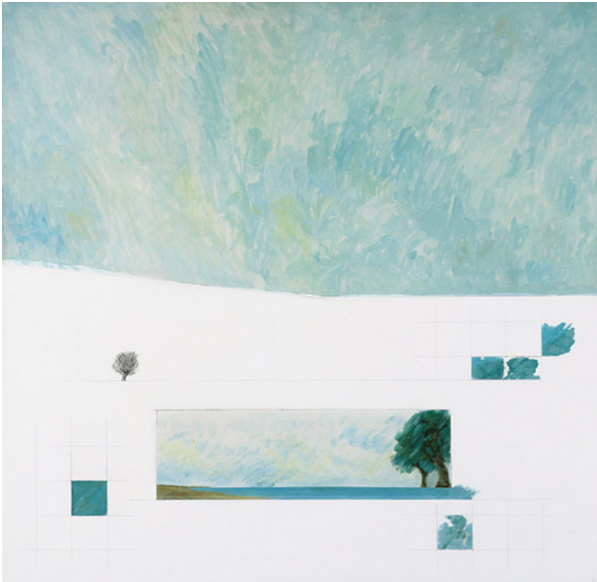
Sin título, de la serie Paisaje, 1973.