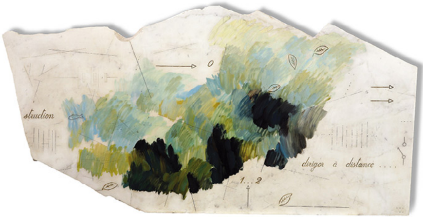
Sin título, 1984.