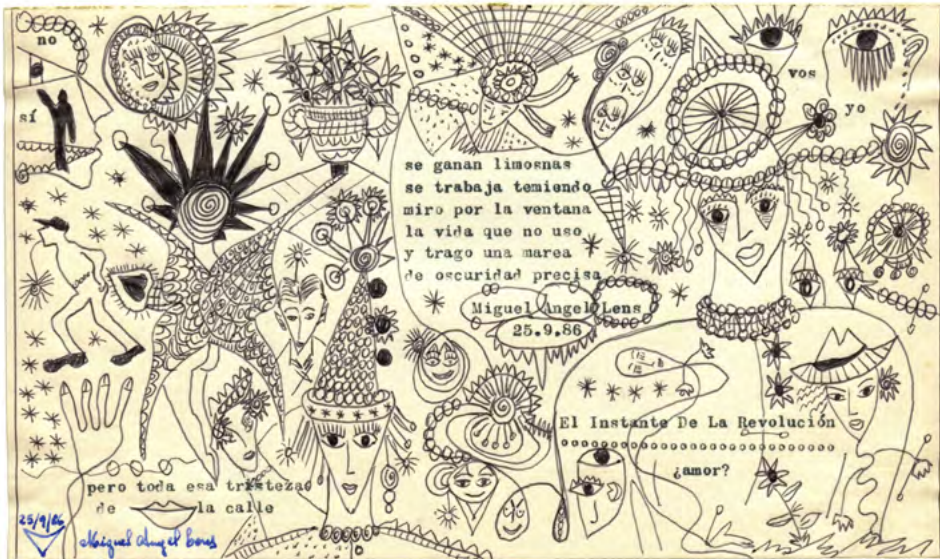
El instante de la revolución , 1986.