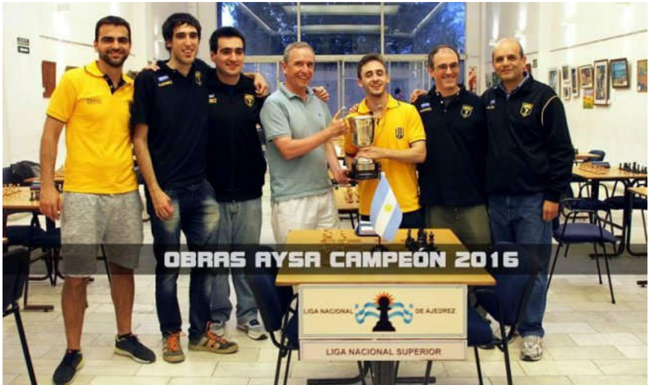
El equipo de Obras Aysa recibiendo su merecido trofeo.

Quien lideraba el campeonato hasta la 8va ronda y era el gran favorito del torneo fue Ajedrez Plus, el equipo conducido por los grandes maestros olímpicos Sandro Mareco y Alan Pichot, que debido a un sorpresivo empate con el Club Argentino de Ajedrez perdió su liderazgo a último momento.