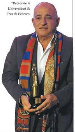
*Rector de la Universidad de Tres de Febrero.