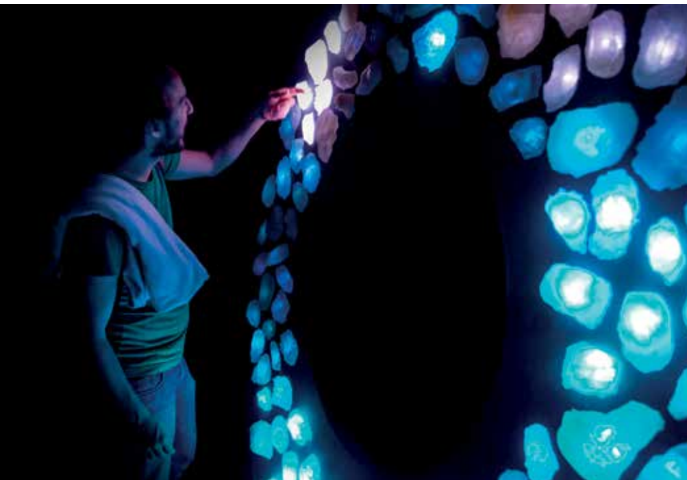
AGUSTÍN RAMOS ANZORENA y PALOMA MARQUEZ PetroLumen , 2017. Instalación lumínica interactiva.

ARTISTAS: LAURA ZINGARIELLO / JAVIER DE AZKUE / DAMIÁN ZANTLEIFER / AGUSTÍN RAMOS ANZORENA y PALOMA MARQUEZ / CARLOS MARULANDA / CARLA ALEMAÑY / PAULA CÁCERES / ANA WOLPOWICZ