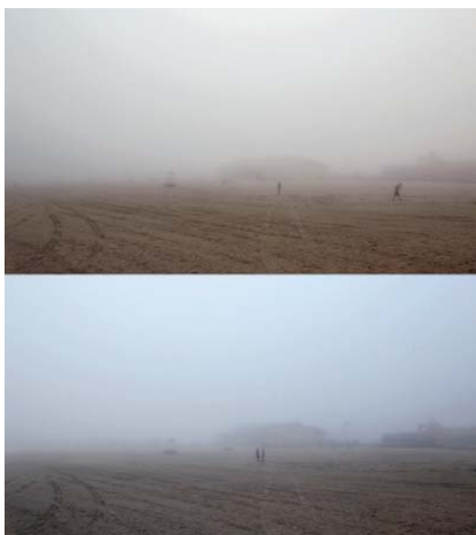
MARINA CAMARGO / Brasil