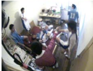
ZHANG QING / China 603 Football Field , 2006 Video