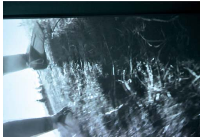
ZWELETHU MTHETHWA & MATTHEW HINDLEY / Sudáfrica "Dying minutes" , 2011 Video