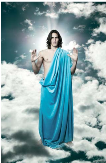
PAULA DELGADO / Uruguay Sálvanos , 2012/2013 Fotografía digital, instalación sonora Nápoles/Montevideo