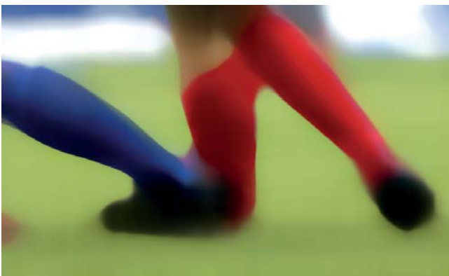
MUU BLANCO / Venezuela Violencia abstracta , 2013 Video