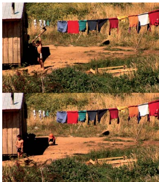
GIANFRANCO FOSCHINO / Chile