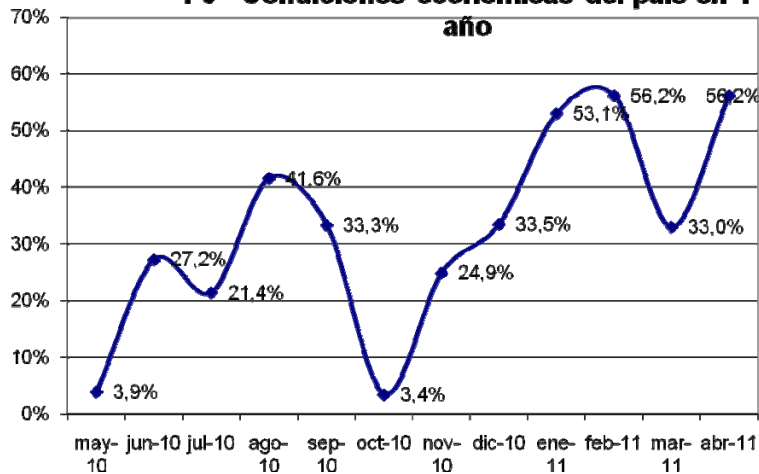
P3 - Condiciones económicas del país en 1 año

El factor que mide las expectativas de la gente acerca de la evolución de su Situación Económica Personal desciende 14,3% impulsado principalmente por un deterioro en el componente que refleja las condiciones presentes del encuestado.